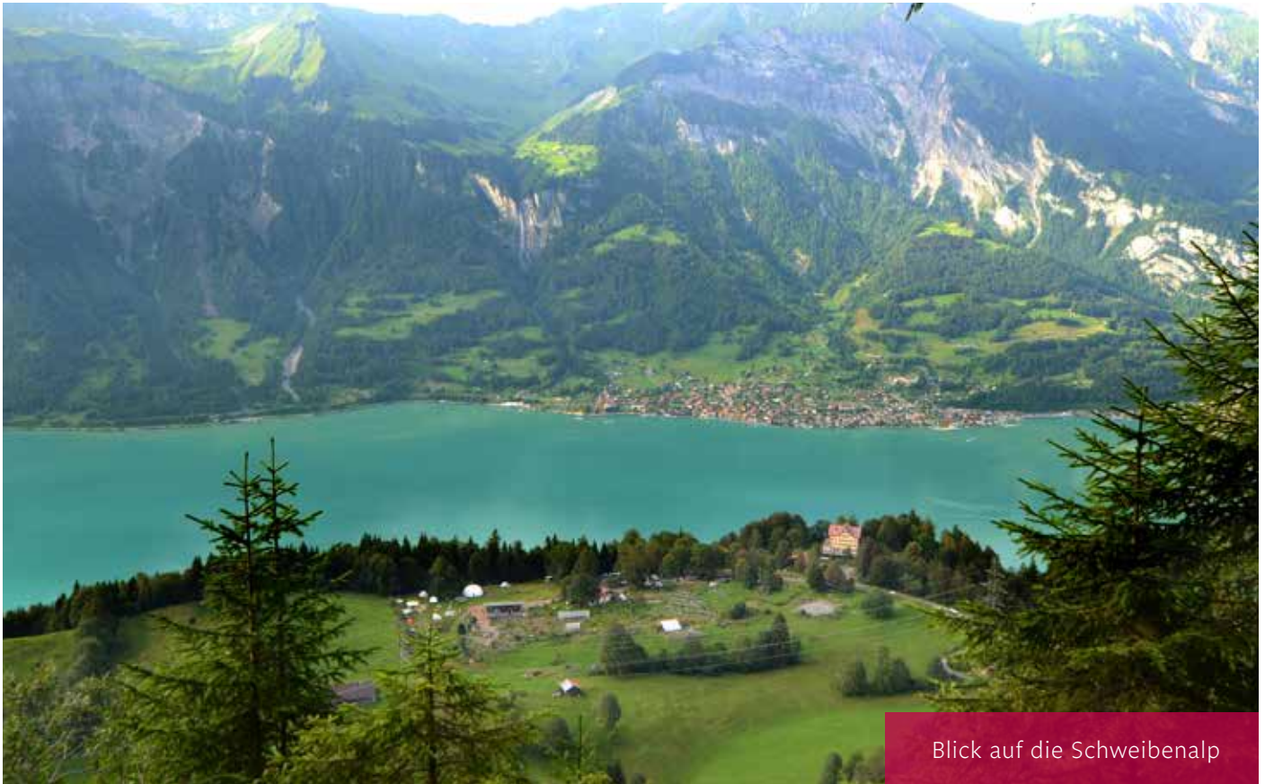
Blick auf die Schweibenalp